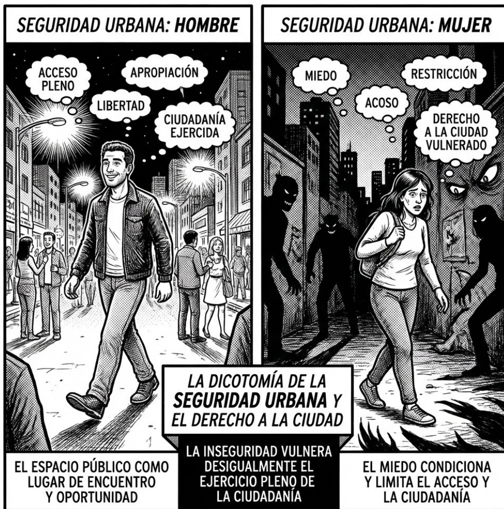
Figura 3. El silencio del miedo.

Nota. Ilustración generada con IA. Google AI, 2025, Gemini 3 Pro Image. [Modelo de lenguaje multimodal].