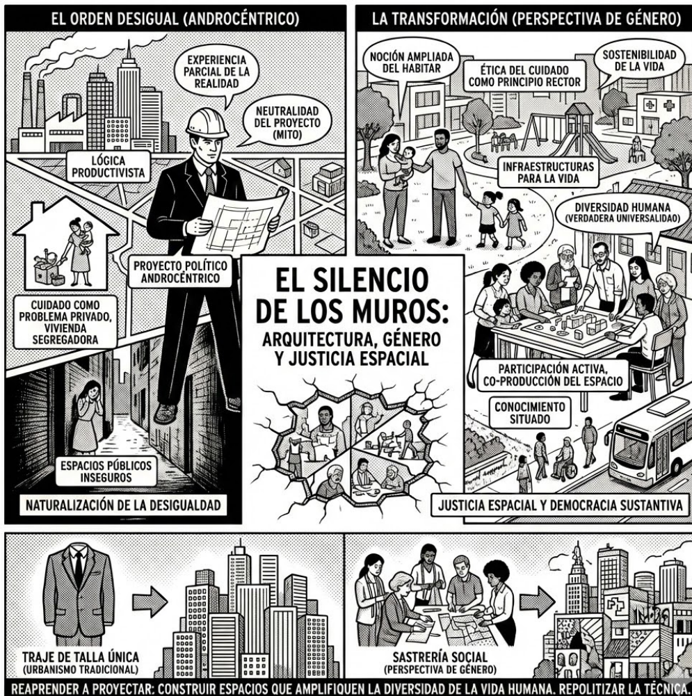
Figura 5. El silencio de los muros.

presentación de esta dimensión, en detrimento de otras variables igualmente relevantes, como la clase, la etnicidad o la edad. En tercer lugar, la selección bibliográfica, orientada por criterios de afinidad teórica, puede introducir sesgos interpretativos que privilegian determinadas corrientes de pensamiento.