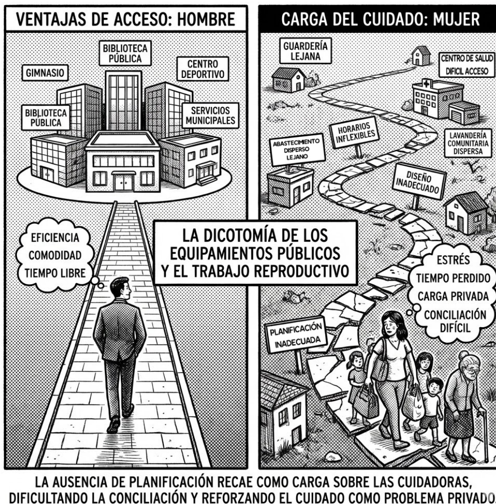
Figura 4. El silencio de la corresponsabilidad.

Nota. Ilustración generada con IA. Google AI, 2025, Gemini 3 Pro Image. [Modelo de lenguaje multimodal].